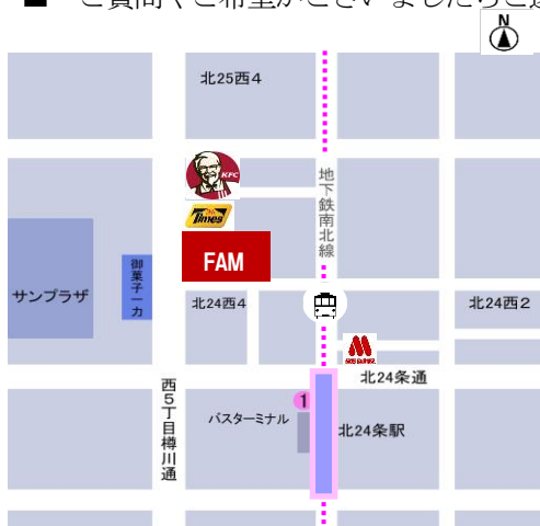
会場(北24条教室)地図