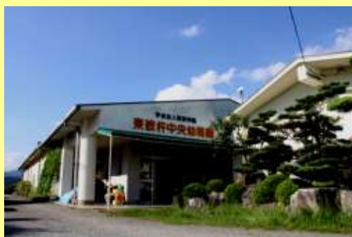
東彼杵中央幼稚園 (年中・年長児)

「認定こども園（幼保連携型）」とは、就学前の子どもに幼児教育・保育を提供する幼稚園、保育園が一体となった施設です。本園は、敷地内にある千綿保育園と共に「認定こども園 つばさ」として認可を受けています。そのため、幼稚園児と保育園児の混成クラスとなり、教育・保育を、保育園園舎で行う場合もあります（近年は年少児クラスを保育園園舎で実施）。