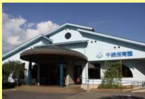
千綿保育園 (0 歳～年少児)