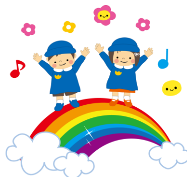
自ら考えて伸びる子ども