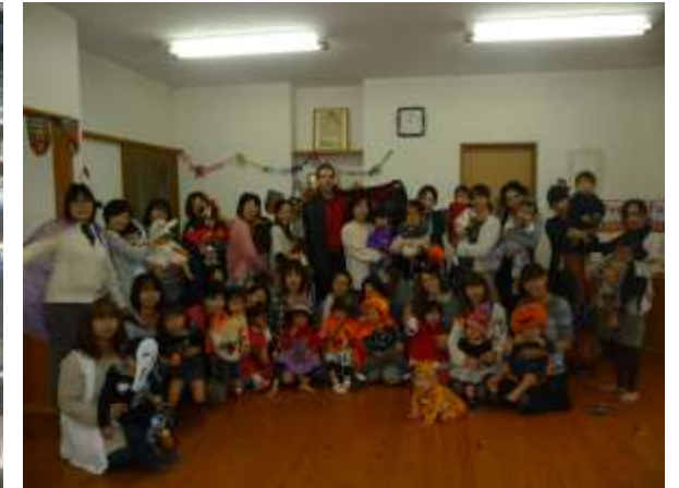
ハロウィンパーティー