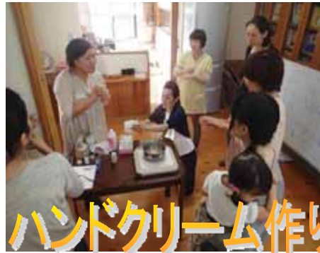
ハンドクリーム作り