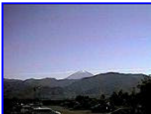
2 11:30 南東