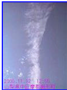
2 12:55 西(上)