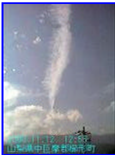
1 12:55 西