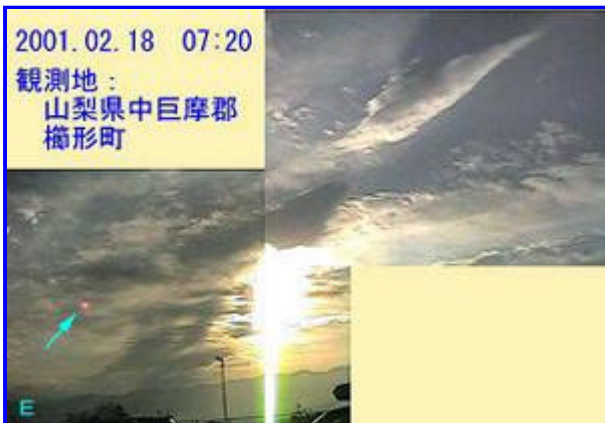
1 07:20 東