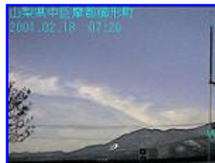
2 07:20 西