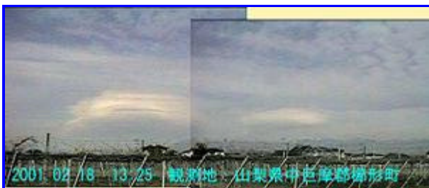
3 13:25 北 - 北北東