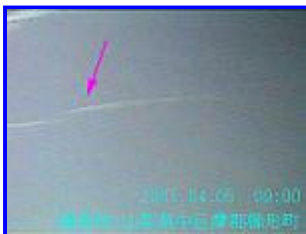
1 09:00 南南東

今日は風も弱く、地気で周りの山が霞んでいた。ほとんどの方向で飛行機雲がほとんどの方向で出来ており、10分以上滞留していました。 下の画像は写りが悪いので雲がはっきり見えません。