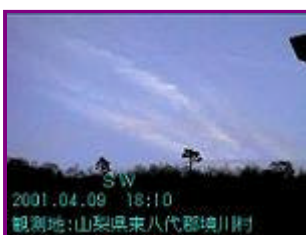
2 18:10 南西