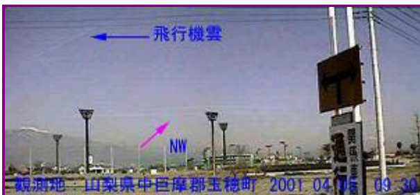
2 09:30 北西

矢印で示した雲は、飛行機雲が風に流されて変形したにしてはあまりにもきれいに切れて平行移動した形になっていました。このすぐ横には一直線の飛行機雲がありました。 この付近は、羽田から九州方面への航路になっていますのでよく飛行機雲がみられます。