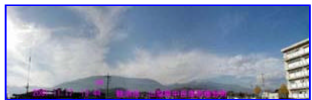
5 13:44 西