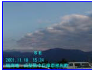
2 画像 1の 2倍ズーム