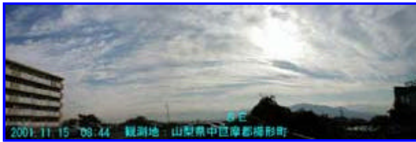
1 08:44 南東

観測日 : 2001年 11月 15日 [ 観測地 : 山梨県中巨摩郡檜形町 ]