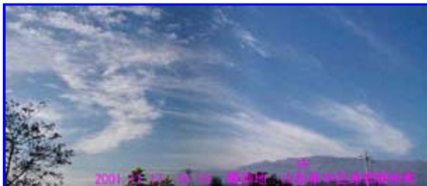
1 10:18 西南西

観測日 : 2001年 11月 17日 [ 観測地 : 山梨県中巨摩郡檜形町 ]