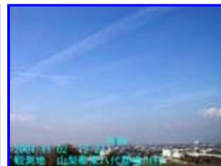
1 12:27 北西

北岳の南側から東東北東に延びる帯雲。飛行機雲より低い位置にあり、釜無川上空付近にはこの雲と交わる南北向きの筋雲が出ていました。 甲府中心部上空を通る航空路はないはずで、また、南側に発生していた飛行機雲より滞留時間が長かったので飛行機雲ではないと思います。