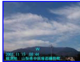
2 08:44 西