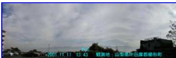
4 13:43 南東