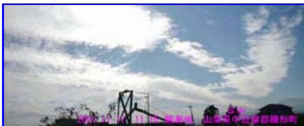
3 11:15 南西