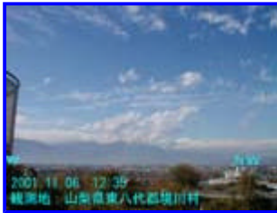
3 12:35 北西

その雲の境川上空の様子です。 画像 1の帯雲は北上し、約 15分後檜形山の北側を通る位置に筋状雲の塊になっていました。 (画像 3) 東は、鹿島灘、西は紀伊水道 - 日向灘を結ぶ線上に注意が必要かと思います。