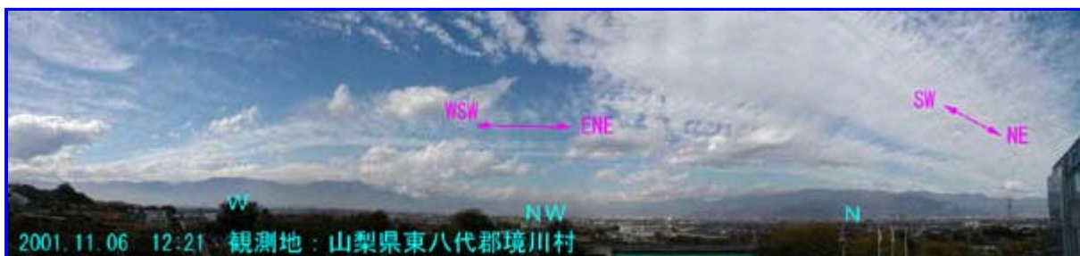
1 12:21 西 - 北 - 北東

12:20頃画像 1のように櫛形山南側から概ね西南西～東北東向きの細い帯雲が出ていました。又、関東山地から観測地の境川村上空を通る高度の低い帯雲も出ていました。画像 2は