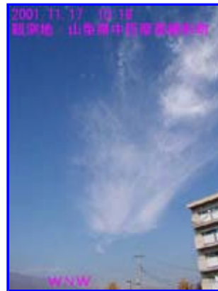
2 10:18 西北西