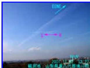
1 12:27 西北西