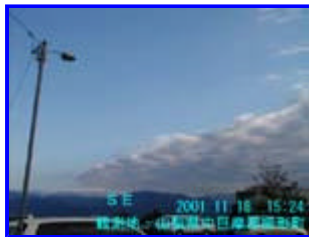
1 15:24 南東

観測日 : 2001年 11月 18日 [ 観測地 : 山梨県中巨摩郡檜形町 ]