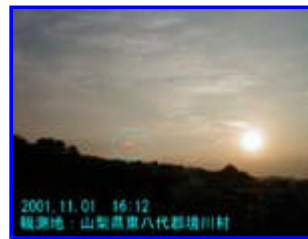
1 16:12 西北西