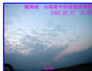
4 18:59 北西

画像2は、パノラマ合成をしたため雲が湾曲し同心円の様に見えますが実際は画像3の様にまっすぐでした。