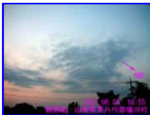
1 18:55 北

今日も地気が強く周りの山は霞んでいました。関東山地に向かった西側の端が連状の雲が出ていました。南アルプス南部にも同様の東側の端が連状の雲が有りましたが、画像 1の雲とは繋がっていませんでした。波の方向は概ね北北東でした。佐渡島周辺から北海道西の日本海 あまり大きくはない (M3~ 4) と思いますが注意が必要？