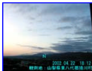
2 18:12 北

画像 1は、櫛形山方面からの概ね東南東方向に延びる3本の太い帯状の雲です。左の2本には波状の模様が付いている部分がありました。4/ 10は放射状でしたが今日は同じ方向に延びていました。