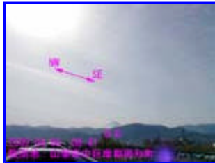
1 08:41 南東