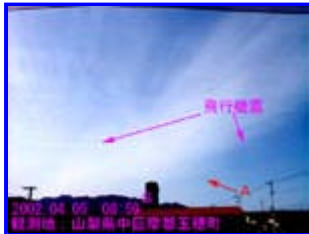
2 08:59 南

北西～南東方向の筋雲。バックが白いためはっきり写っていません。甲府盆地の地気は弱く富士山ははっきり見えていましたが、富士山より東は地気が強いようで太陽光が乱反射して画像 1の左側はデジカメで撮影しても真っ白になりました。