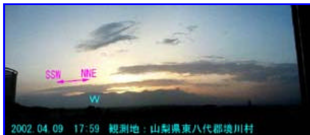
2 17:59 西 - 北西

南側に延長線上は静岡県西部 (川根 - 磐田) - 遠州灘、北側の延長線上は新潟県中越 - 北海道南西沖 M4前後と思います。