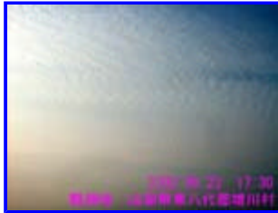
2 17:30 北