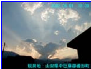
4 18:09 北西