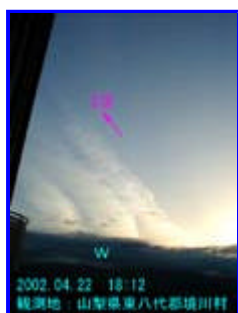
1 18:12 西