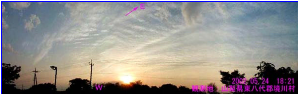
1 18:21 西 - 北西 - 北