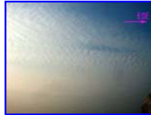
3 17:30 北東

今日も晴れていましたが地気が強く、夕方には視界が3~4km位になり、甲府市内のビルも見えませんでした。