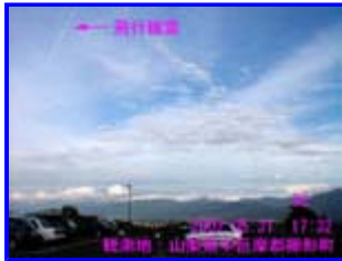
1 17:32 南東