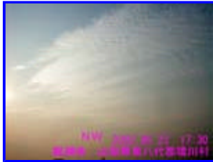
1 17:30 北西