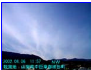
1 11:57 北西

北岳方面から出ていた放射状の雲です。この方向からだけでなく南アルプス全体から放射状に雲が出ていましたが南側の方はぼやけていました。