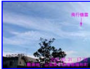
3 17:32 南南西