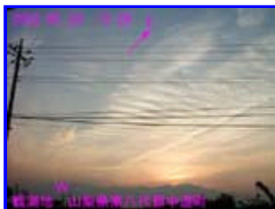
2 18:28 西