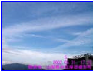
2 17:32 南