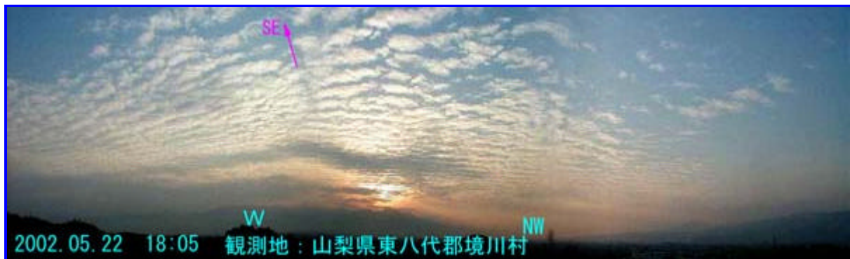
2 18:05 西 - 北西

今日は久しぶりに晴れて暑い1日でした。 17:30頃南アルプス北部から概ね南南西向きの帯雲が出ていましたが、よく見ると連状になっている部分がありました。波状の方向は、雲と同じ方向でした。[画像1] 30分後の様子が画像2です。波の方向が南東向きに変わっていました。