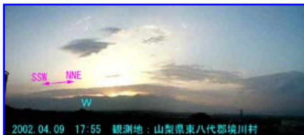
1 17:55 西 - 北西

北西方向 (諏訪方向)には、同方向に向いていると思われる筋雲が数本見えましたが、画像が暗く写っていません。