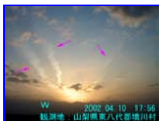
1 17:56 西

北岳方面から3本の放射状の雲です。(オバQの頭のように)左の2本には波状の模様が付いていました。これとほぼ直角に筋雲も出ていました。