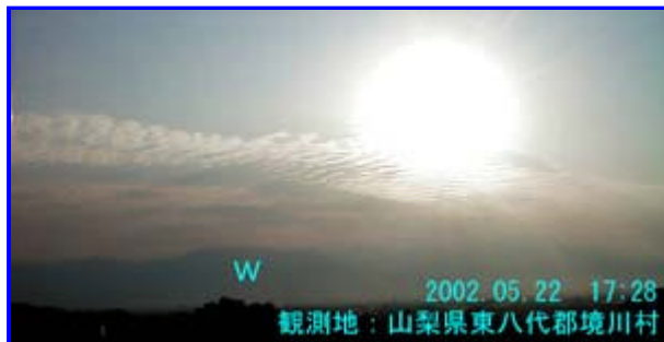
1 17:28 北西

今日は久しぶりに晴れて暑い1日でした。 17:30頃南アルプス北部から概ね南南西向きの帯雲が出ていましたが、よく見ると連状になっている部分がありました。波状の方向は、雲と同じ方向でした。[画像1] 30分後の様子が画像2です。波の方向が南東向きに変わっていました。