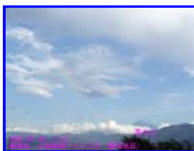
1 17:07 南東