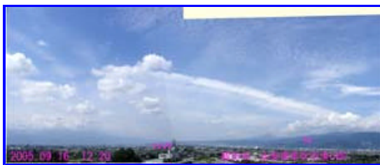
3 12:20 北西 - 北