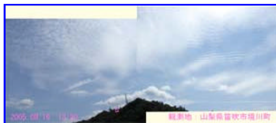
2 12:20 南南東