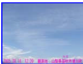
1 12:20 東