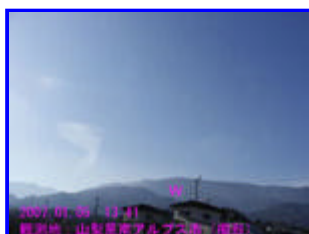
2 13:41 西