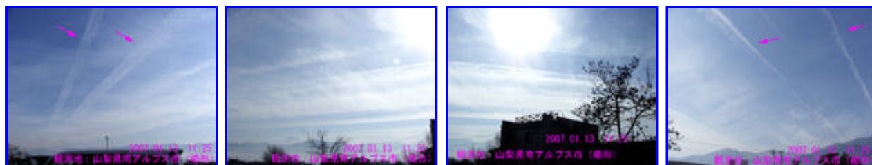
1 11:25 東 2 11:25 南東 3 11:25 南南東 4 11:25 西南西 矢印の雲は、飛行機雲です。