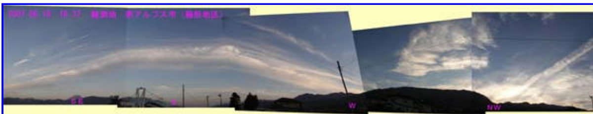
2 18:36 東 - 南 - 西