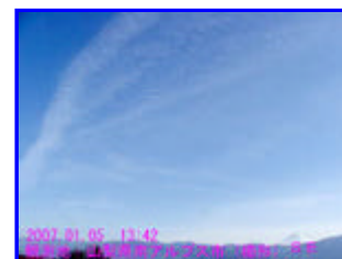
6 13:42 東 - 南東

画像5の雲は途中で切れていましたが、画像1の雲と同一線上にありました。観測地点からは、赤石岳付近と丹沢方面に架橋しているように見えました。発震した場合は、3日以内に山梨県東部～神奈川県西部付近で震度2程度と推察しています。