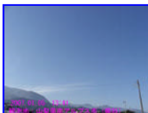
3 13:41 西北西