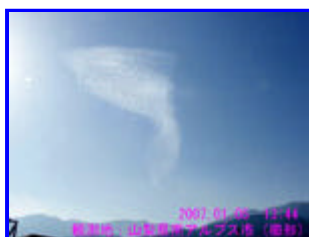
4 13:44 西南西