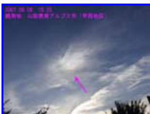
1a 18:25 西