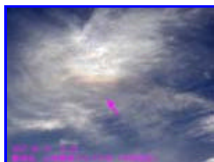
1b 18:26 西