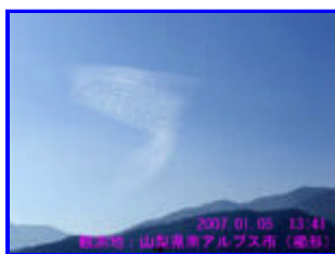
1 13:40 西南西