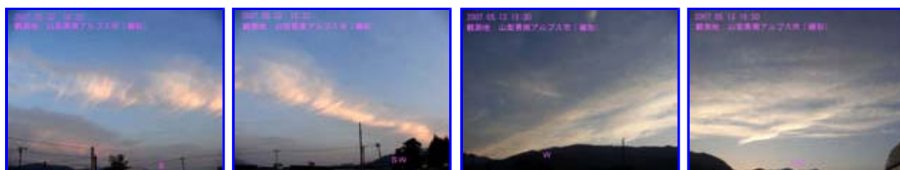
1 18:32 南 2 18:32 南西 3 18:30 西 4 18:30 北西 画像 1, 2の北東側は画像 3, 4とは別のかなり遠い震源と架橋していると推定しています。 画像 3, 4は、渥美半島沖 - 秩父方面に架橋しているように見えました。