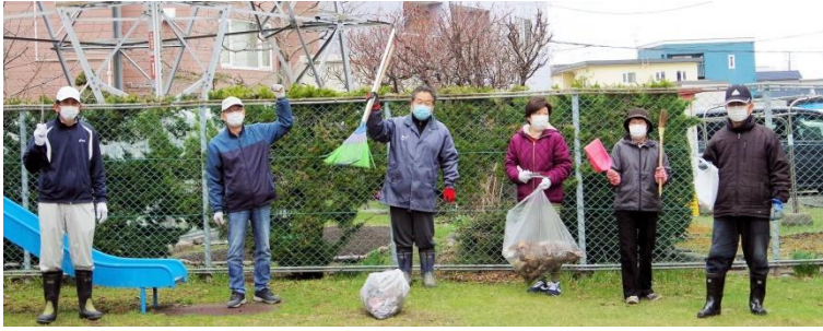
4/26 春の大掃除にマスク付けて参加 (20区)

・会員数は令和2年1月1日現在で3千951人です。昨年から純増は、26名と微増です。賛助会員数は55社で、昨年より3社減少しています。