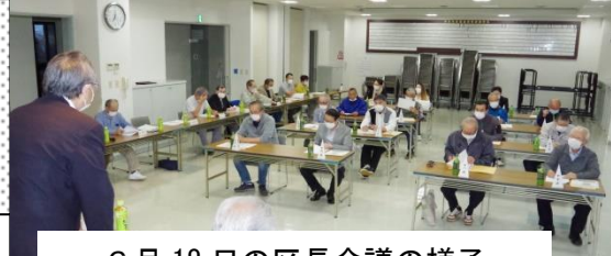
6月18日の区長会議の様子

6月17・18日の両日、第1回の区長会議が新型コロナウイルス対策の「3密防止」の為に2回に分けて開催されました。この間、区長会議も中止され総会も書面表決書対応となったため、今年度初めて討議する場となりました。出席された区長は28名で従来よりも出席率が上りました。会合の後半では例年開催している、北郷東町内会の概要と取組内容、区長の基本任務や防災組織について再確認の研修会が行なわれました。