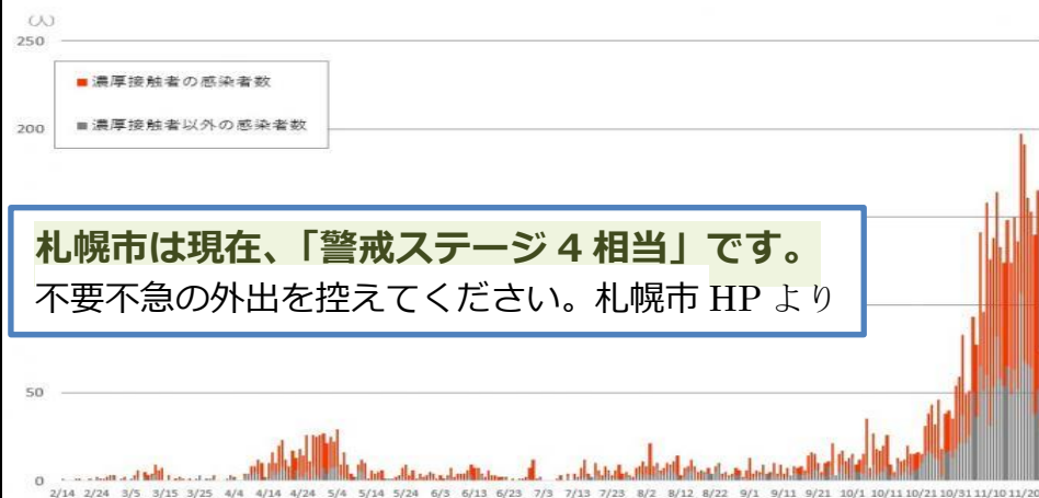
札幌市における感染者状況(濃厚接触の有無別) (11月25日現在)