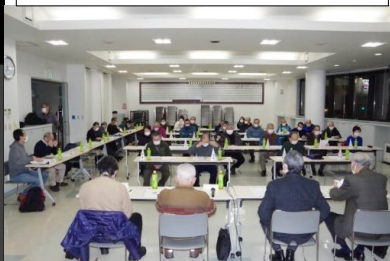
(写真下) 2月2日開催された 第3回区長会議の様子

(3) コロナ自粛下で町内会は何か出来るか?何をすべきか?ご意見をお聞かせ下さい。書面表決書の空欄に、記入願います。 区長会議に諮問したところ、「区に戻されても困る。感染対策や防災対策に活用すべき」等の意見を頂きた。特別会計の「会館会計」は、休館対応もあって大幅な赤字となりましたが、道及び市からの休業協力金が40万円入金されて、前年より収支は改善しました。 ・財政の安定度を示す次年度の繰越現預金(会館積立金1千万円を含む)は、2千910万円となりました。これは、年間の会費収入(約2千300万円)除排雪会費を含むを上回る金額となります。