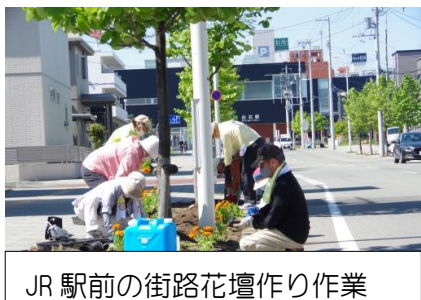
JR 駅前の街路花壇作り作業

令和2年度は世界中がコロナパンデミックの影響を受け、町内会活動も飲食を伴うイベントや交流会合は全面的な活動自粛となりました。「郷土まつり」「盆踊り」(厚生部)、「お楽しみ旅行会」「教養講座」(女性部)「あさかぜ子供会」(青少年部)「新年交礼会」「交通安全キャンペーン」などが中止となりました。東会館も知事の要請に添えて、40日間休館対応をとり、感染対策も万全にしました。