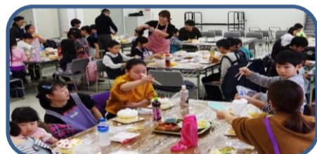
クリスマス会の様子②

10月 親子レク ボーリング大会 送迎バスでボーリングをした後に焼肉バイキングでおなかを満たして帰りました。