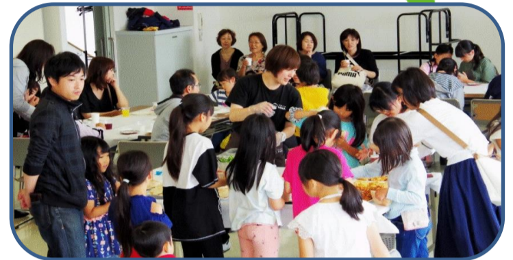
ピタパン作りの様子

5月 あさかぜ子ども会募集イベント ピタパン作り なんとこの年は予想を超える50名以上の子どもたちが加入し、途中で材料がなくなるハプニングも!!