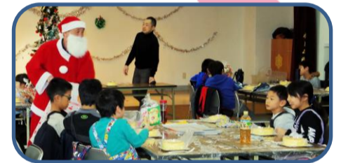
クリスマス会の様子①

ひとり1台(15cm)のデコレーションケーキを作りました。家族で分けても十分な大きさのケーキ。大事そうに持って帰る子、その場で半分食べちゃう子も。サンタクロースからプレゼントも頂きました。