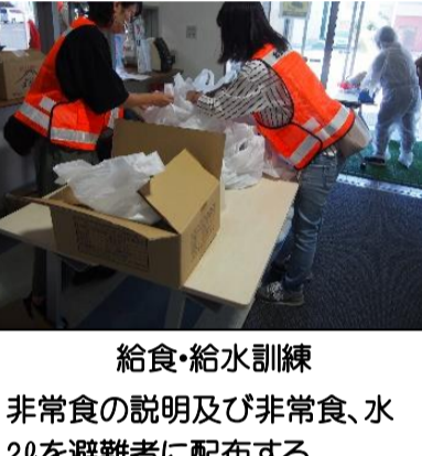
給食・給水訓練 非常食の説明及び非常食、水20を避難者に配布する。