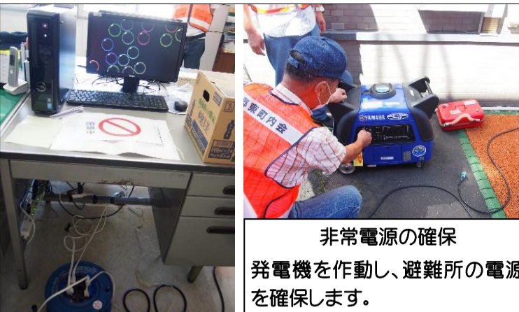
滞在スペースの設営① 机、ごさを利用して滞在エリアを作ります。