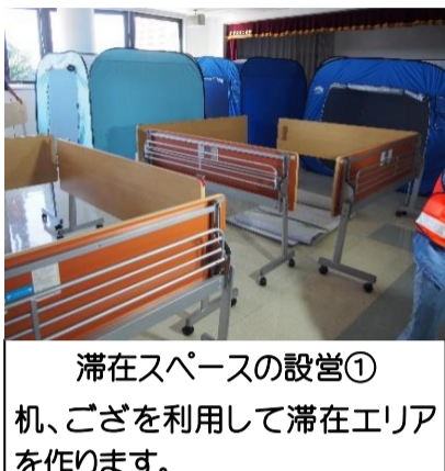
滞在スペースの設営② テントを設置して閉じられた滞在スペースを作ります。