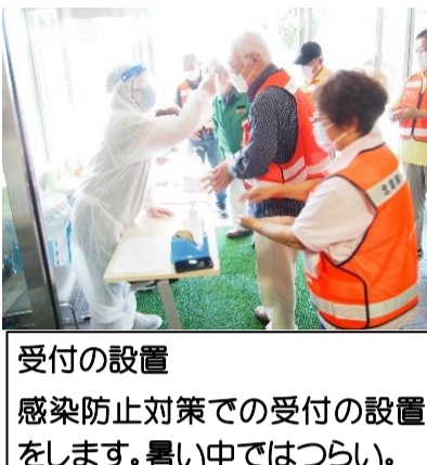
受付の設置 感染防止対策での受付の設置をします。暑い中ではつらい。