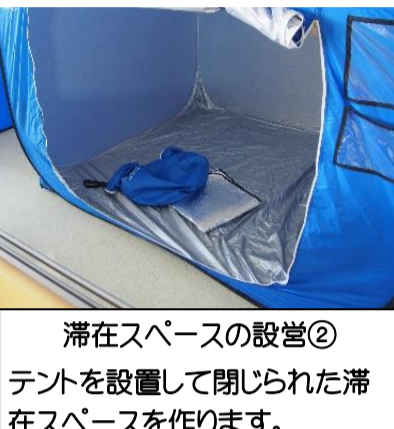
滞在スペースの設営① 机、ごさを利用して滞在エリアを作ります。