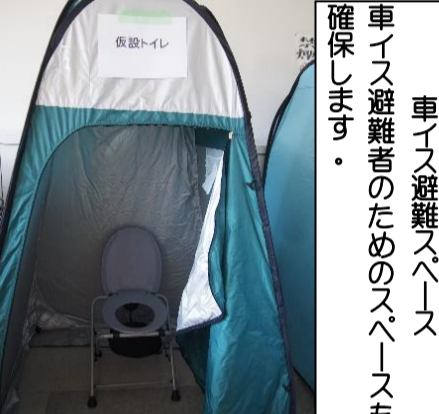
簡易トイレの設置万が一に備え簡易トイレも設置します(屋外設置を想定)。