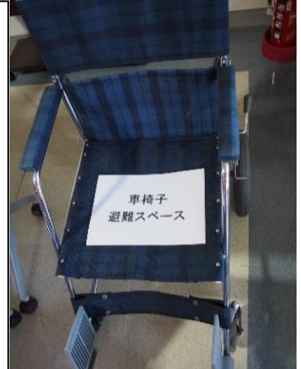
車イス避難スペースも確保します。