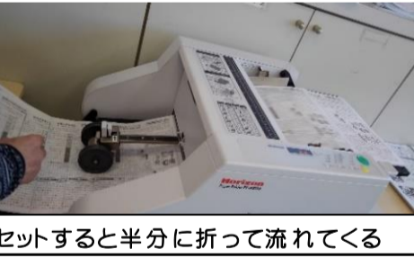
セットすると半分に折って流れてくる

発生します。これらの作業は9時30分ごろから12時ごろまでかかります。あと1〜2名いればより助かりますし、都合が良いときだけでも結構ですのでどなたかお手伝いいただければありがたいです。