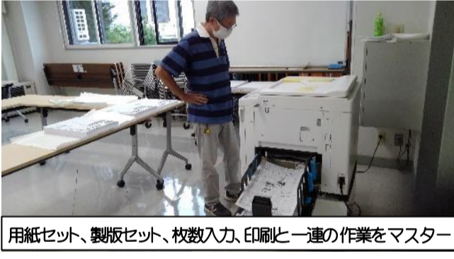
用紙セット、製版セット、枚数入力、印刷と一連の作業をマスター

広報紙「きたごうひがし」の印刷・紙折りを作業を東町内会の登録サポーターさんにお手伝いしていただいています。東町内会では、町内会の担い手不足などの課題解決のためのアンケートを経て、サポーター登録制度を設けています。広報部は現在2名の部員で活動していますが、毎月の印刷・紙折りは2名では困難で、毎回副会長や他の役員の方の協力を得て行っています。そのため7月に登録サポーターの皆さんにハガキで呼びかけし、今は1名のサポーターさんが来てくださり大変助かっております。ありがとうございます。ごさいます。