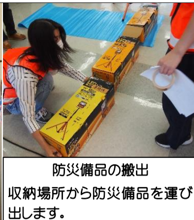
防災備品の搬出 収納場所から防災備品を運び出します。

9月11日(土) 10:00から、北郷東会館において北郷東町内会自主防災会避難所訓練を実施しました。今年度は町内会役員約30名が参加して、収納備品の取り出しに始まり、停電時の非常電源確保、受付・滞在スペースの設営、給食・給水訓練を行いました。