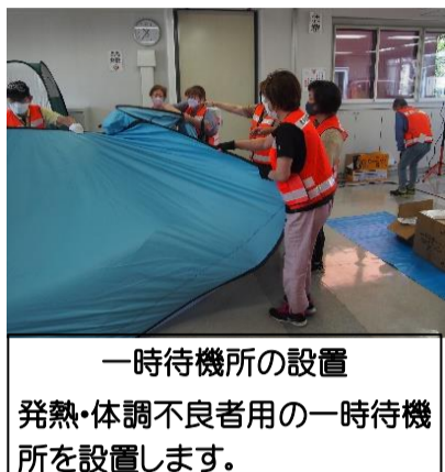
一時待機所の設置 発熱・体調不良者用の一時待機所を設置します。