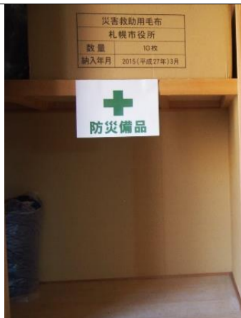
非常電源の確保 発電機を作動し、避難所の電源を確保します。