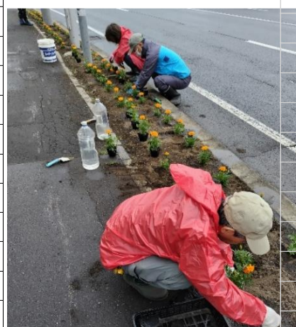
水源地通り沿いの花壇に花植え