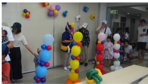
バルーンプレゼントには大勢押し掛けました