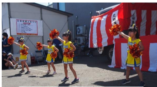
スタジオ140のチアダンス