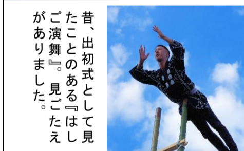
昔、出初式として見たことのある『はしご演舞』。見ごたえがありました。

9月3日(日)、4年ぶりの北郷東郷土まつりが開催されました。晴天に恵まれ、会場の東会館駐車場は溢れんばかりの大賑わいとなりました。役員の成り手不足・高齢化のため、テーブルなど大きな会場備品はレンタルとし、売店は商工会や少年野球チームのサラブレツツの皆さんに協力をお願いしました。 また、会計の簡素化のため売店で現金を扱わない食券方式を採用しました。単純計算で1,500枚ほどの食券が売れましたが、参加会員の皆さんの協力により大きな問題にもならず運営することが出来ました。 イベントは4年ぶりということもあって出演交渉に苦労しましたが、新しいイベントもあって、それなりに楽しんでいただけたのではないかと自負しています。 今年実施のイベントは次のとおり。 ① 北郷小学校金管バンド(17名) ② スタジオ140 チアダンス&バントワリング(25名) ③ 子どもジュース早飲み大会(5回×10名) ④ キッズバルーン(183人) ⑤ ビンゴ大会(2回) ⑥ 北郷生協ダンススクール ⑦ ミュージックライフを楽しむ会(4グループ) ⑧ はしご演舞 ⑨ お楽しみ抽選会(458世帯参加) 来年も開催できるように、会員皆様の運営協力をお願いいたします。