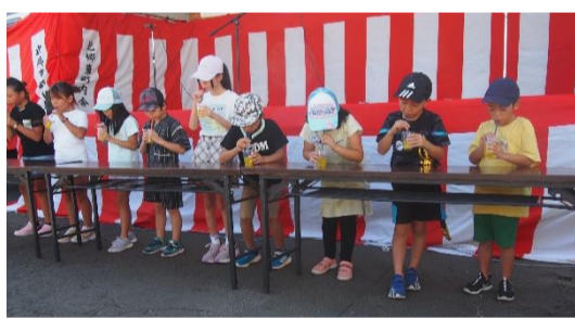
ジュース早飲み大会でがんばる子どもたち