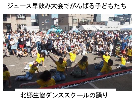
北郷生協ダンススクールの踊り