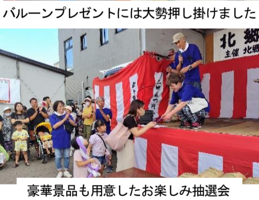
豪華景品も用意したお楽しみ抽選会