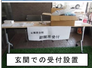
玄関での受付設置

1階では受付、一時待機所テント、簡易トイレ、LED照明の設置を行いました。また、裏口付近に発電機を設置しました。