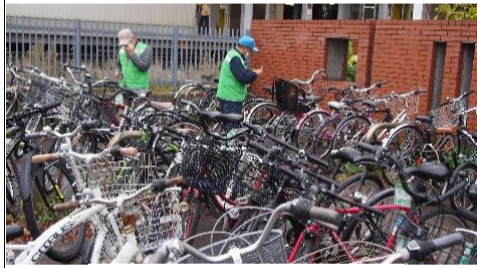
駐輪場での注意書き付け