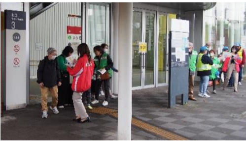
駅北口での啓発活動

駅前を通り、啓発品を手渡ししながら呼びかけました。また、自転車の盗難も白石駅は非常に多いそうで、駐輪場の自転車にツーロック（鍵を2重にかける）推奨の注意書きを付けました。