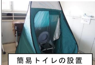
簡易トイレの設置