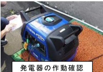
発電機の作動確認