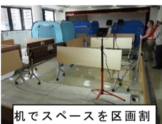
机でスペースを区画割