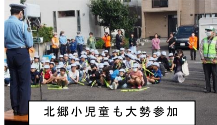
北郷小児童も大勢参加

北白石地区交通安全特別街頭啓発が、9月29日（金）に北郷東会館駐車場で実施されました。町内会をはじめ各団体のほか北郷小学校の4年生が大勢参加され総勢200名の参加となりました。開会式では白石区長、白石警察署長のあいさつの後、白石警察署から街頭啓発時の注意事項の説明がありました。次に北郷小学校の児童からの交通安全決意表明を行い、最後に「ゆうゆうクラブ代表から「重大事故及び死亡事故の防止に向けて」の交通安全宣言が行われま