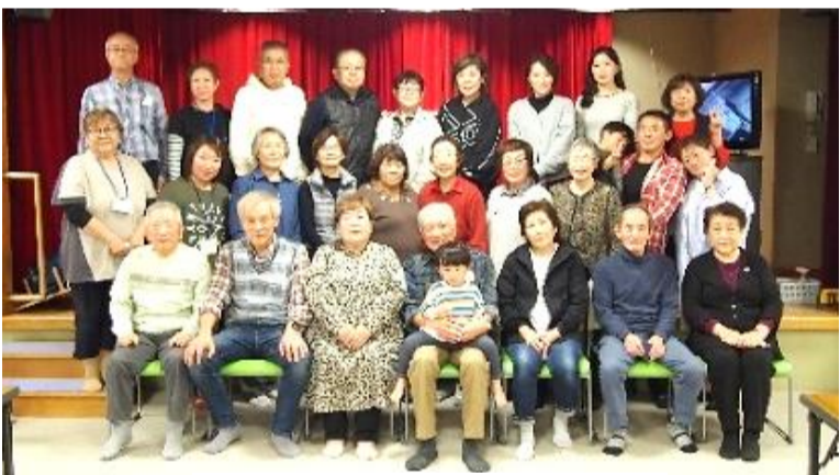
最後は全員で記念写真

バスレクに参加者のアンケートから「よく考えられた楽しい企画と進行にお礼申し上げます。とても楽しかったです。参加者募集に関して勝手な思いを申し上げます。受付時に東会館に向くハイドルが高い人が一杯いると思います（例えば70歳以上の方、スタスタ歩けない人）。そのような方のため20〜30%枠は電話申し込みとさせていただきます。」 女性部から「ご参加ありがとうございました、新しい企画をして良かったです。来年度の募集について、たくさんの方に参加してもらえような方法を今から考えていきたいと思えます。貴重なご意見ありがとうございます。」