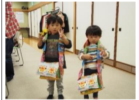
お菓子のおみやげ

予算的にバス利用が厳しい状況です。参加したい方が続かない可能性があります。引き続きご意見を伺い、改善してまいります。