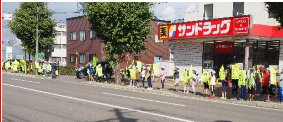
沿道で交通安全を呼びかけ

沿いで一列に並び、黄色い小旗を掲げ、通行するドライバーに交通安全を呼びかけました。今回はたくさんの方の参加もあり、豪華な街頭啓発となりました。朝また10月16日にも街頭啓発を実施します。