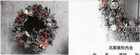
★写真はイメージです