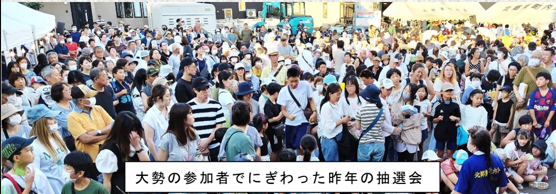
大勢の参加者でにぎわった昨年の抽選会

例年どおり売店とイベントで楽しんでいただけますが、今年から売店はすべて地域の協力団体をお願いすることとなりました。