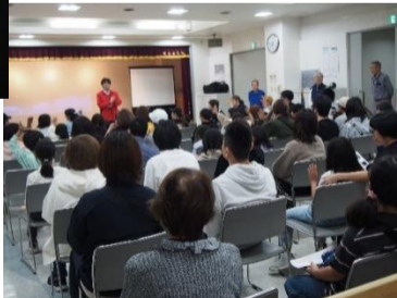
左:お話を聞く90名の参加者の皆さん

また、月・火星に始まり銀河系やさらに遠い宇宙も見る事ができ、皆さん満足されたのではないかと思います。来年もリベンジしたいです。