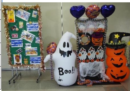
昨年のイベントの写真ブース

恒例となりましたハロウィンイベントを実施します。一斉清掃を終えて、仮装をして北郷東会館へお越しください。