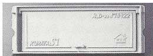
アルミニウムS型正面