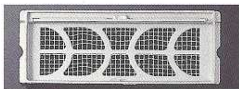
アルミニウムS型開放