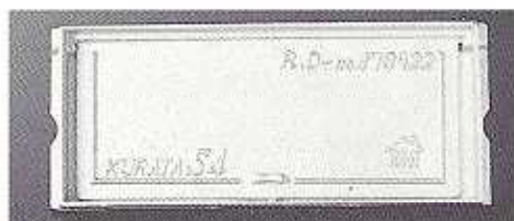
アルミニウムS4号正面