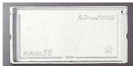
アルミニウムS5号正面