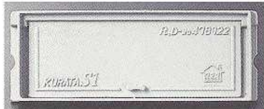
鑄物 S1 号型正面