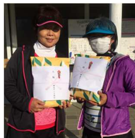
中西(紋別)/古館(網走)