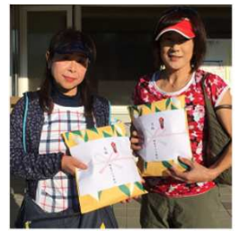
倉(旭川)/堀(上富良野)